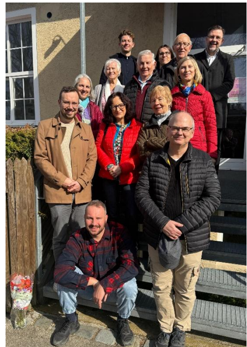
Bilder von Reinhard Wagner